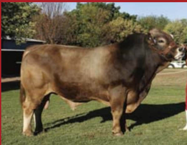
Luigi LLG 11 52 Nasionale Braunvieh Grootkampioen en Vryburg Interras groot kampioen bul.

Kontak Andre Reitsma vir meer besonderhede - 0718961466