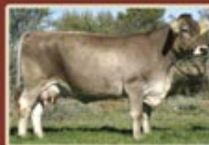
CDH Timotei moeder van CDH Maverick