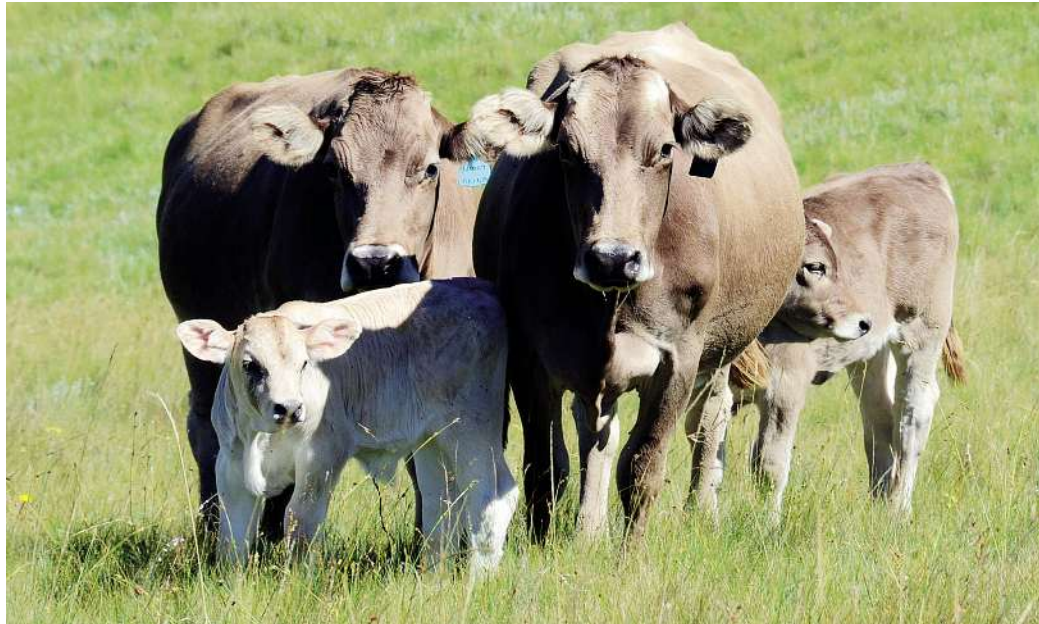
Die goeie kalfpersentasie van 95 is aan kruipvoeding te danke.

"Daar is boere wat meen dat verse wat vroeg kalf, nie so groot gaan uitgroei nie. Ons erva-